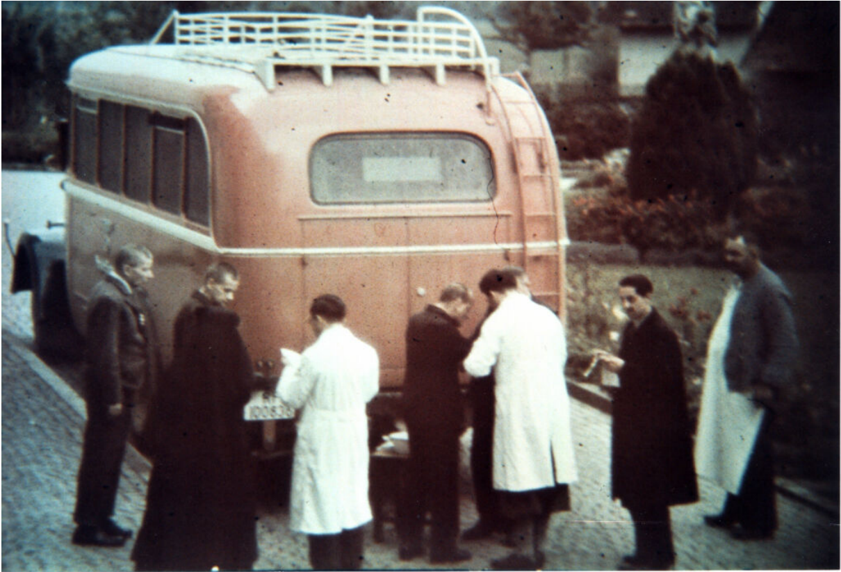
Einer der Busse, mit denen die Todgeweihten abgeholt wurden. Dieses Bild zeigt eine Deportationsszene in Liebenau im Jahre 1940.